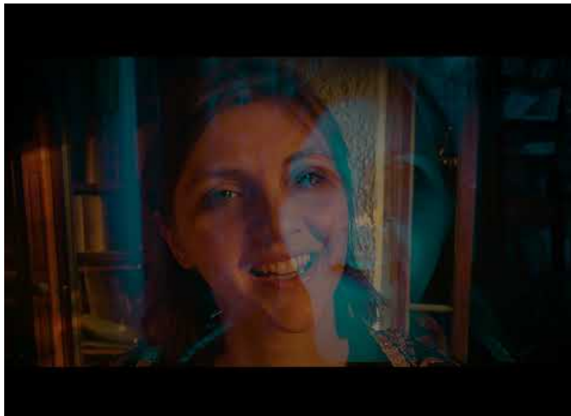
Le clip de la chanson « Bleus-nuit » réalisé par Rosalie.